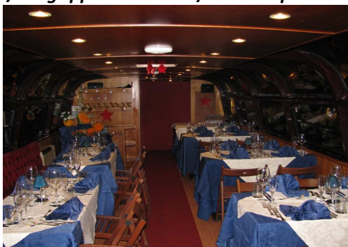
M/N Agrippina – interni / mise en place cena