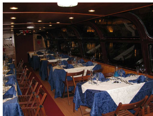
M/N Agrippina – interni / mise en place cena