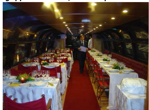
M/N Agrippina - interni / mise en place cena di gala