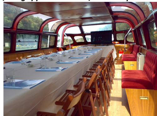
M/N Agrippina – Allestimento sala meeting